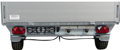
Z 3000 B - 5,25 x 2,04 m Rampenschacht