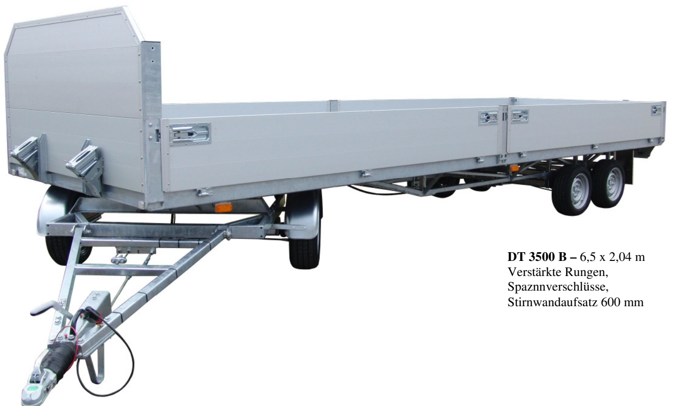
DT 3500 B - 6,5 x 2,04 m Verstärkte Rungen, Spaznverschlüsse, Stirnandaufsatz 600 mm