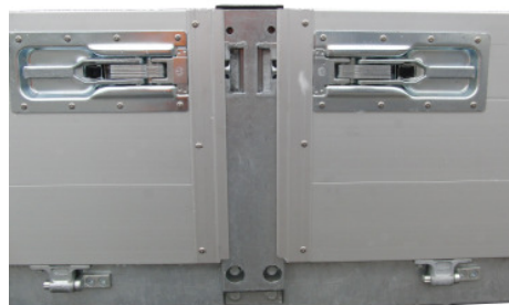
Verstärkte Mittelrunge mit Spannverschlüssen