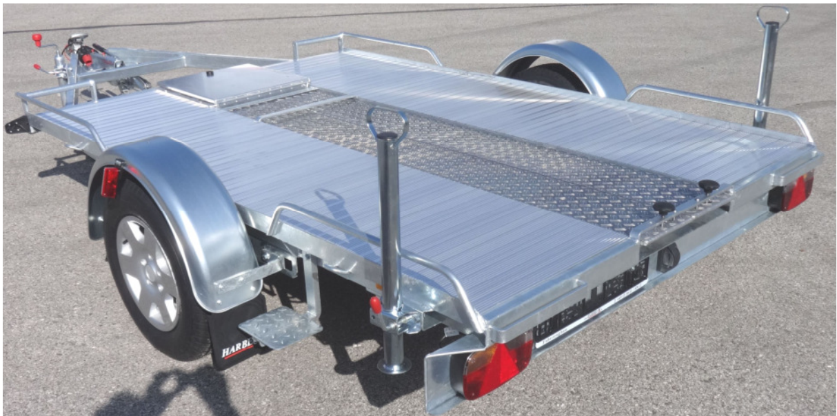
Abbildung unten links: Motorradequipment I (Vorderradbügel und Motorrad-Auffahrschiene nicht abgebildet) Abbildung unten rechts: Motorradequipment II